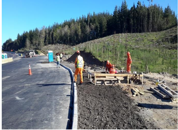
Ejecución de Paraderos y Pasarela Peatonal Ruta O-672, Dm. 50.960, Sector A