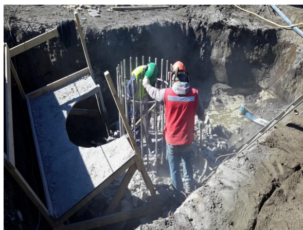
Fundaciones Pasarela Peatonal Cabrero, Dm. 2.060, Sector A