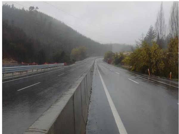
Calzadas Ejecutadas, Dm. 50.350, Sector A