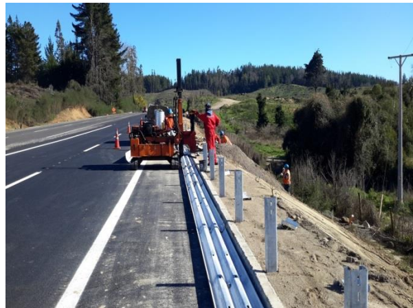
Instalación de Defensas Metálicas Triple Honda, Dm. 44.050, Sector A