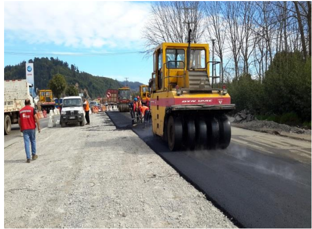
Pulverización Pavimento de Hormigón (Rubblizing) y Colocación Carpeta Asfáltica, Tramo Dm. 68.000 – Dm. 70.000, Sector A