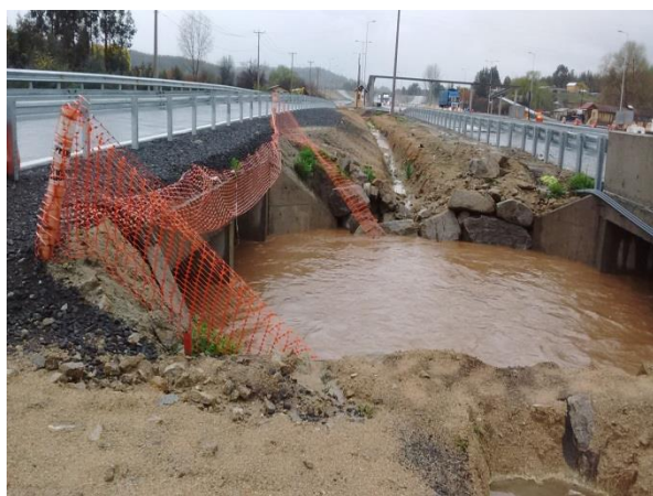
Funcionamiento Obra de Arte N° 79, Dm. 23.730, Sector A