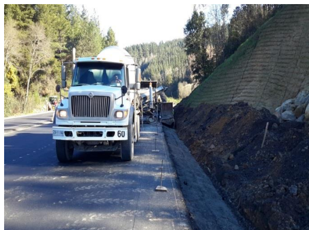
Ejecución de Cunetas de Hormigón, Dm. 46.000, Sector A