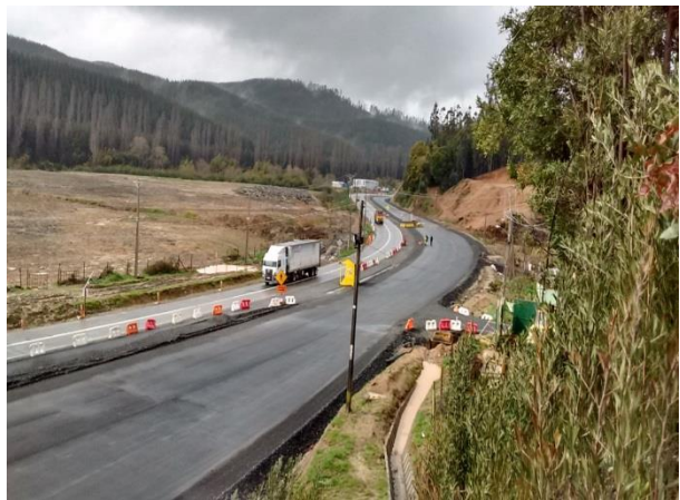
Calzada Lado Sur Pavimentada, Dm. 62.800, Sector A