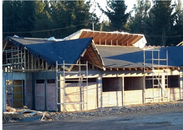
Edificaciones y Marquesina Sector Plaza de Peaje, Dm. 34.000, Sector A